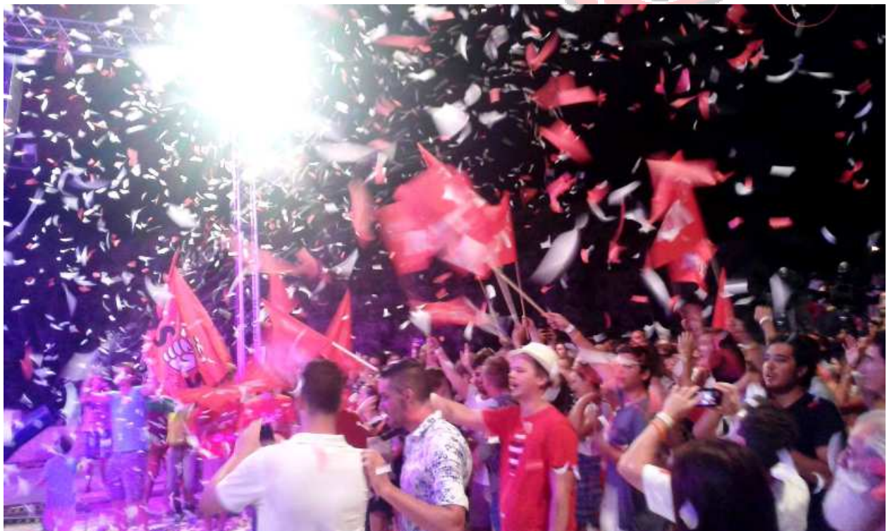
Gelebte internationale Solidarität