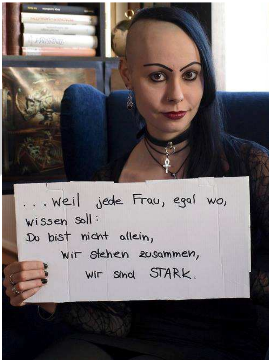
Der Internationale Frauentag ist wichtig...

Unsere gelungene Aktion unterstrich: "Wer die menschliche Gesellschaft will, muss die männliche überwinden."