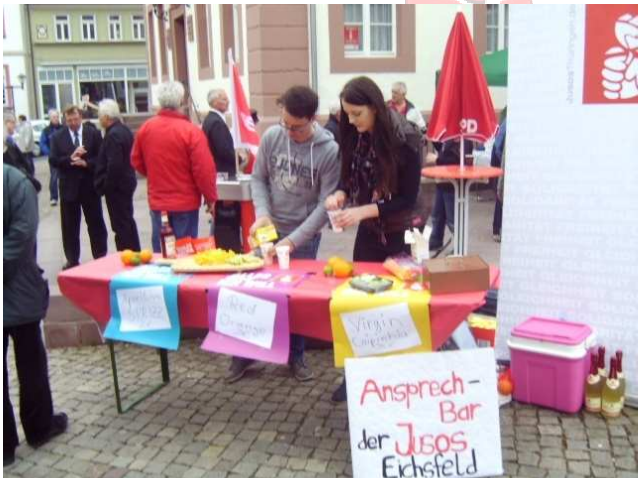
Wir Jusos beim Cocktail mixen

Auch wir Jusos waren da natürlich mit am Start. An unserer "AnsprechBAR" konnten die vielen Besucher_innen mit uns in Gespräch kommen und dabei leckere Cocktails genießen. Besonders erfreulich war das wir auch ein neues Mitglied wir an diesem Tag begrüßen durften.