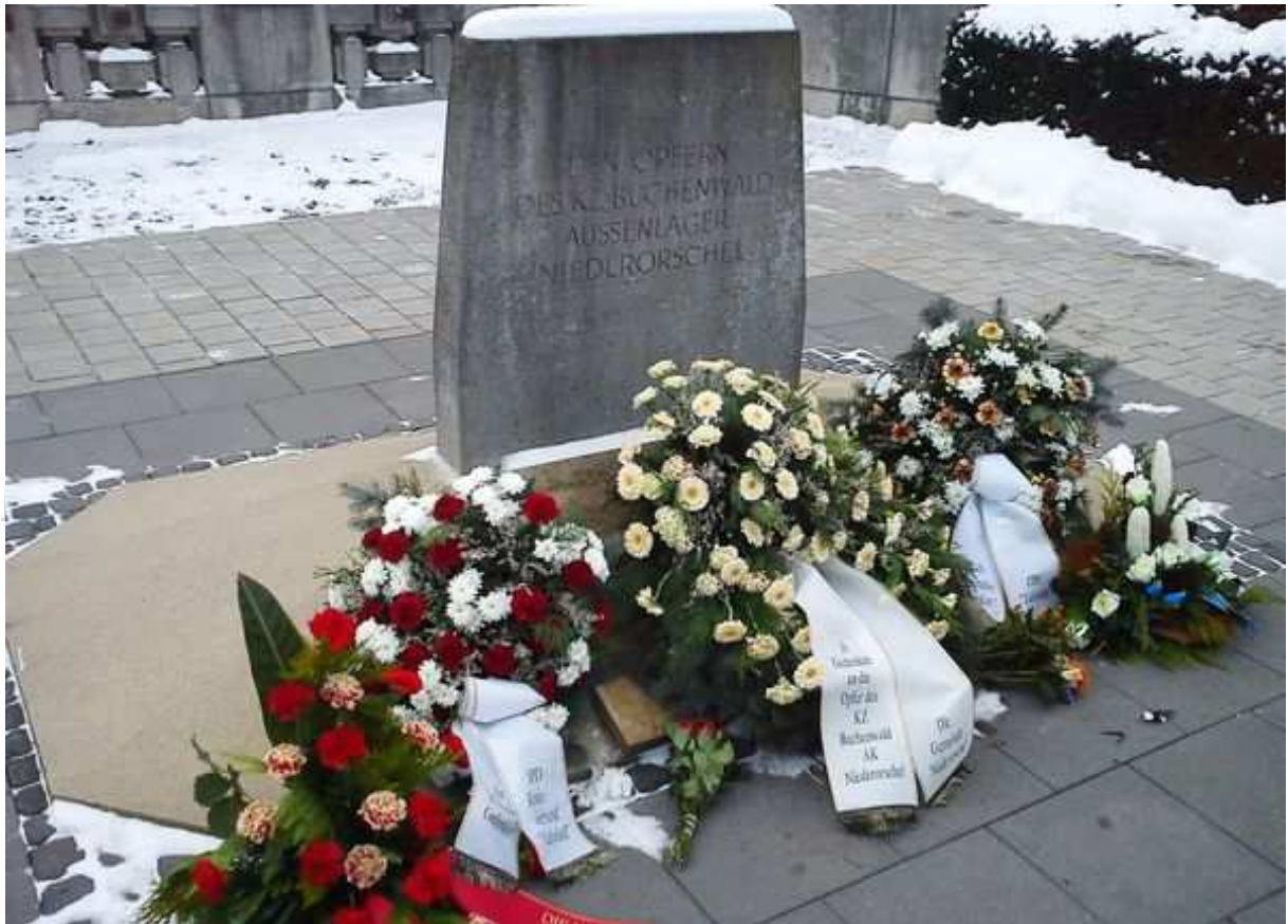
Kränze zum Gedenken

Vielen Dank an die Organisator_innen, Helfer_innen und allen Menschen die an der Veranstaltung teilgenommen haben!